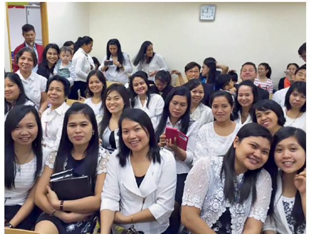
98 hermanos y hermanas en la fe se reunieron en octubre de 2018 para el Servicio Divino con el Apóstol Mayor

lugar de reuniones estuvo instalado en North Point. En el curso de los años, ante todo las familias Lam, Choi y Kowk fueron la columna vertebral de la comunidad.