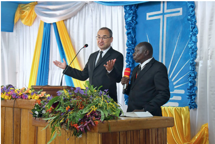
2.700 participantes se reunieron para el Servicio Divino; la prédica fue traducida en el altar del francés al suajili

delante de los hombres, para que se puedan admirar de nosotros. Esto es algo que Jesús rechazó profundamente”.