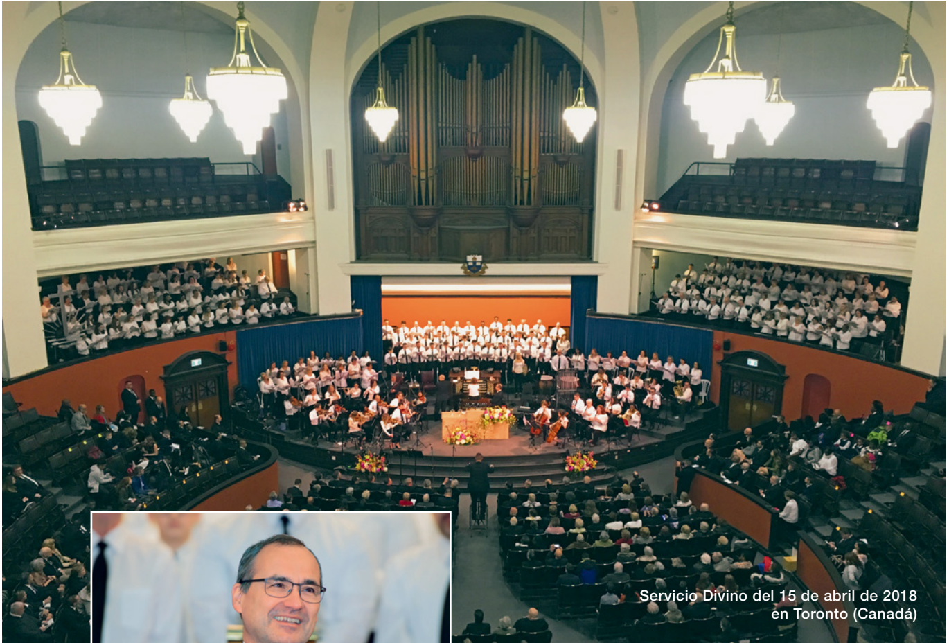
Servicio Divino del 15 de abril de 2018 en Toronto (Canadá)