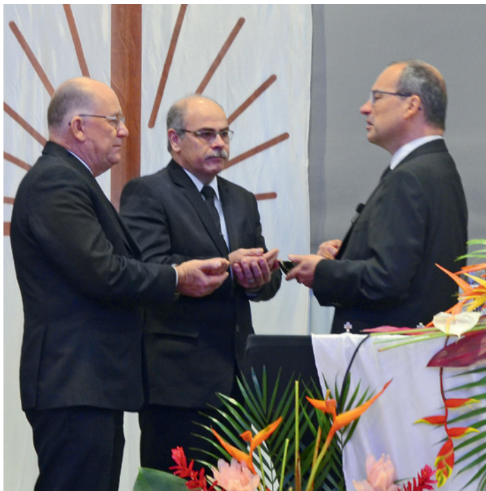
438 fidèles se sont rassemblés à l'hôtel Holiday Inn à Natal (Rio Grande do Norte, Brésil). La prédication de l'apôtre-patriarche était traduite en consécutive à l'autel en portugais et en espagnol.