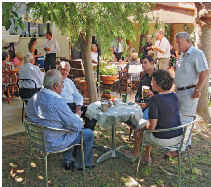
Rencontre à l'issue d'un service divin à Limassol (Chypre)

et sœurs, est la forme de l'aide divine, qui se joue au niveau émotionnel. Un exemple : En 2006, il y a eu une guerre. C'est terrible lorsque des avions larguent leurs bombes. Une sœur m'a dit : « C'était terrible, mais j'avais malgré tout une certaine paix intérieure. » Elle était persuadée que cette paix intérieure était due aux nombreuses prières en faveur des frères et sœurs du pays.