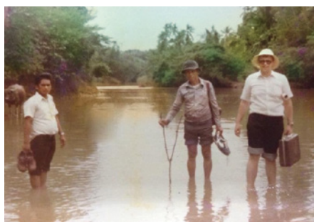
Trabajo misionero a pie, en barco o en moto