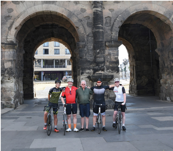
Izquierda: Delante de la Porta Nigra en Trier (Alemania) Derecha: Dos ciclistas en el Camino de Santiago