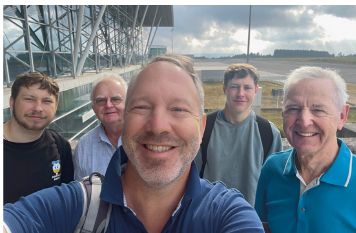
Isquierda: El punto cero del Camino de Santiago Derecha: Cansados pero felices emprenden el vuelo de regreso a casa