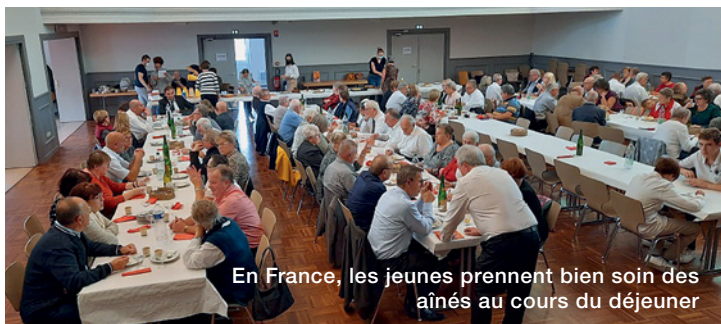
En France, les jeunes prennent bien soin des aînés au cours du déjeuner