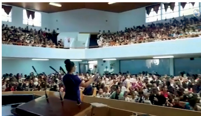
Environ 60000 enfants ont joué de la flûte à bec lors du service divin pour enfants célébré par l'apôtre-patriarche en 2019