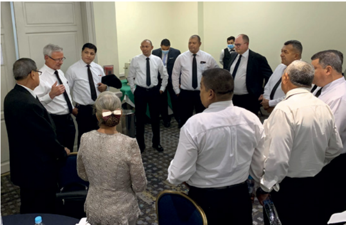
Les frères et sœurs ont apprécié la belle ambiance qui régnait avant et après le service divin

Même les choses que l'on pense être trop petites et insignifiantes peuvent être dites à Dieu : « Nous pouvons venir à Dieu avec n'importe quelle requête, n'importe quelle question, aussi petite soit-elle. » Car Dieu dit : « Je m'occupe de tout, je m'intéresse à toi. » Et Jésus dit : « Je compte même les cheveux sur ta tête. » Rien n'est trop petit ou pas assez important pour le dire à Dieu. « Raconte-lui tout ce qui se passe dans ton cœur. Quoi qu'il arrive, parle simplement à Dieu. »