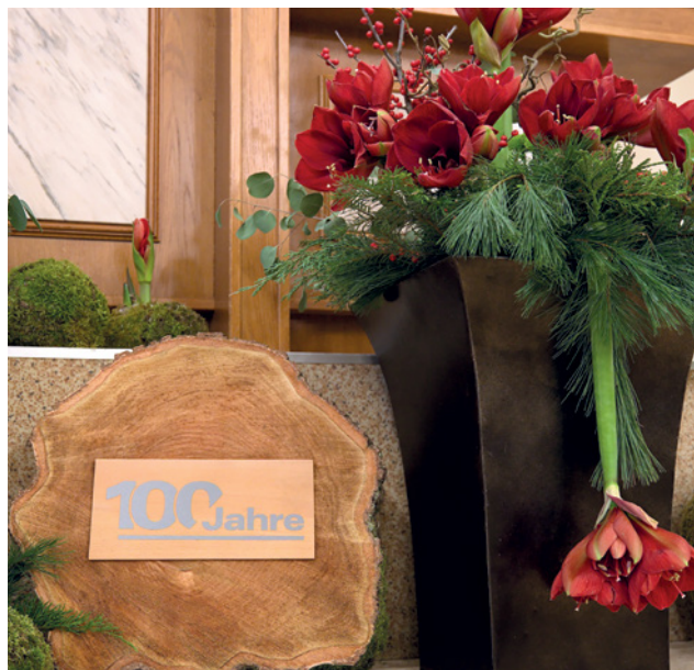
Emplie de joie dans la perspective de la visite de l'apôtre-patriarche, la communauté s'y était préparée depuis longtemps

se battre pour rester fidèle. Mais si nos ancêtres ont réussi à rester fidèles, s'ils n'ont vu aucune raison d'abandonner malgré les difficultés, pourquoi devrions-nous dire aujourd'hui : « Oui, mais nous ne pouvons pas le faire. » Il n'y a aucune raison d'abandonner ! Continuons simplement à suivre le Seigneur. Ce qu'il a fait il y a cent ans, il continuera à le faire pour nous à l'avenir. Il nous donnera toujours la force de rester fidèles jusqu'à la fin. Cessons donc de nous plaindre et de gémir éternellement. Ce n'est pas plus difficile que cela ne l'était pour nos ancêtres. Le Seigneur est fidèle. Il nous donnera jusqu'à la fin la force dont nous avons besoin pour rester fidèles. Et tous ceux qui le veulent vraiment atteindront le but.