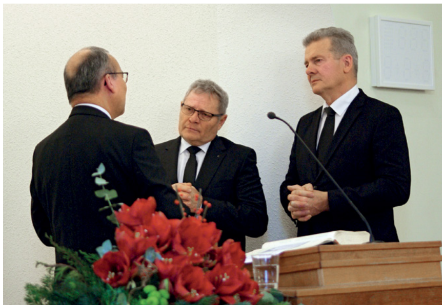
La sainte cène pour les défunts était emplie d'émotion

turellement, nous sommes exposés à la tentation. Mais il est écrit dans le Catéchisme : L'homme n'est pas soumis à la tentation sans la moindre volonté. Nous avons parfois l'impression que nous ne pouvons pas faire autrement. Nous sommes emportés par le flux humain. Non, nous ne sommes pas obligés de faire tout ce qu'on nous propose, de faire tout ce que font les autres. Nous pouvons dire non. Le péché est devant ta porte, mais toi, domine sur lui. Avec l'aide de Christ, tu peux dire « non » au péché. Tu peux dire : « Non, je ne le ferai pas, quelles que soient les conséquences pour moi, c'est un péché, cela va à l'encontre de la volonté de Dieu. » Régnons sur nos vies et maîtrisons notre propre vie et nous-mêmes. Oui, de nombreuses personnes disent qu'aujourd'hui les gens ne sont plus que des marionnettes, que quelqu'un tire les ficelles et qu'en fait, on peut en faire ce qu'on veut. Mais pas avec moi. Le diable ne peut pas faire de moi ce qu'il veut. Avec l'aide de Christ, je peux maîtriser ma vie et ma nature.