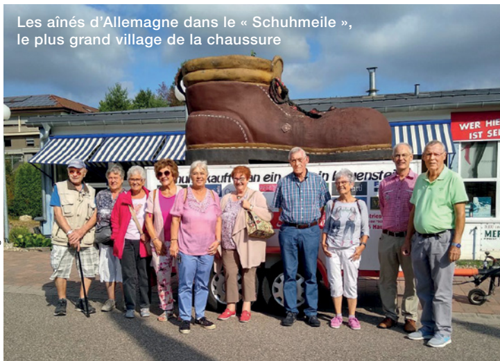
Les aînés d'Allemagne dans le « Schuhmeile », le plus grand village de la chaussure