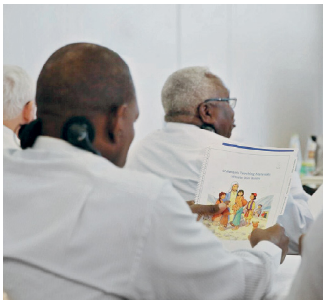
Présentation du nouvel ouvrage pédagogique lors de l'assemblée des apôtres de district