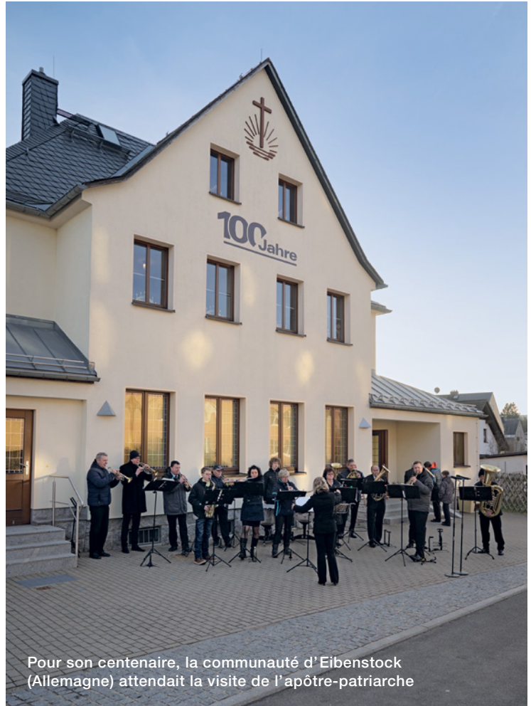
Pour son centenaire, la communauté d'Eibenstock (Allemagne) attendait la visite de l'apôtre-patriarche

La seconde mort n'a point de pouvoir sur eux ; mais ils seront sacrificateurs de Dieu et de Christ, et ils régneront avec lui pendant mille ans.