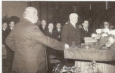
Grugahalle, Essen, letzter Gottesdienst von Stammapostel Bischoff, Ostern 1960