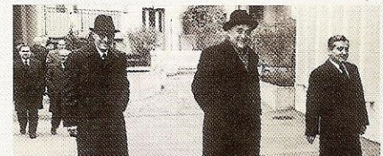
Ausschnitt aus Seite 34 der Kirchenzeitschrift "Unsere Familie" vom 20. Mai 2008