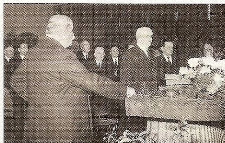
Grugahalle, Essen, letzter Gottesdienst von Stammapostel Bischoff, Ostern 1960