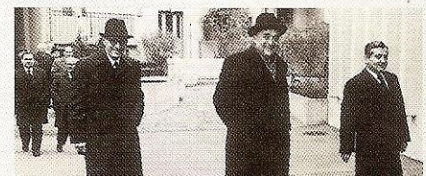
Ausschnitt aus Seite 34 der Kirchenzeitschrift "Unsere Familie" vom 20. Mai 2008