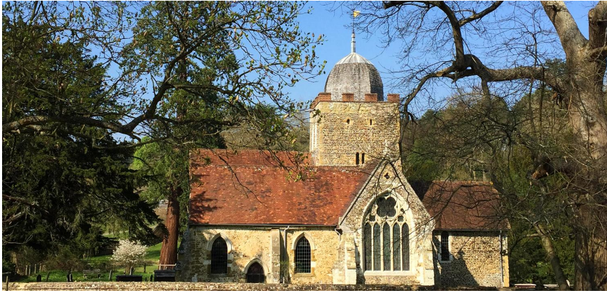
« L'église Saint-Pierre et Saint-Paul » à Albury (Angleterre).