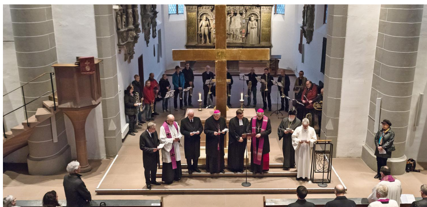
Office religieux à Darmstadt (Allemagne), en 2018

Pour en savoir plus, veuillez consulter le Catéchisme