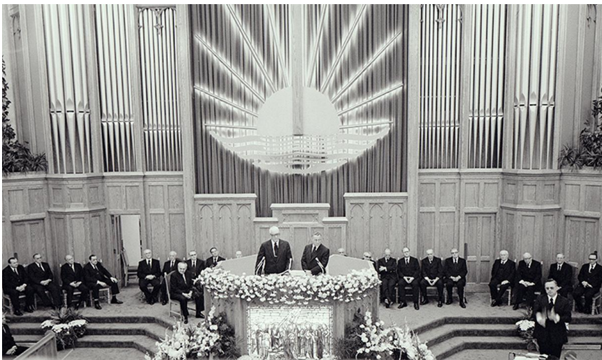
Service divin en l'église de Kitchener-Centre (Canada), en 1977