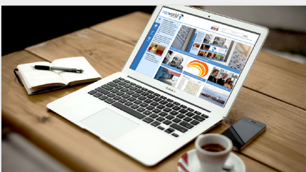
Social Media Guideline der Neuapostolischen Kirche

Was damit genau gemeint ist und wie sich das umsetzen lässt, das erläutert die Guideline, die sich hier herunterladen lässt.